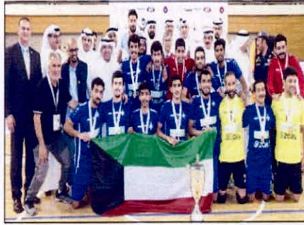
التطبيقي، حصد المركز الأول والميدالية الذهبية لكرة الصالات.

التوقف بفضل رعاية سمو رئيس مجلس الوزراء الشيخ جابر المبارك للدورة، مهتماً كل اللاعبين والفرق الفائزة في مسابقاتها المختلفة.