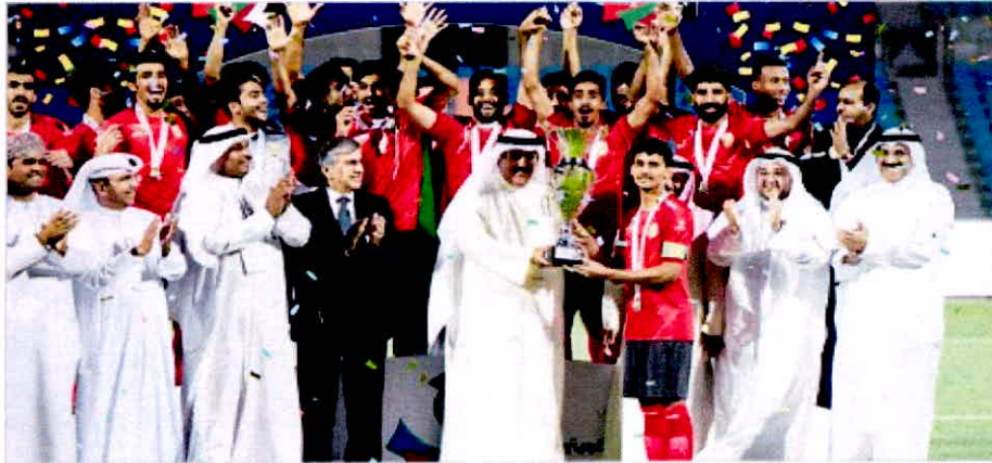
الشكر على المحض وقيادات التطبيقي يتوجون جامعة قابوس

ومع الوجدان ان هذه الدورة شكلت فرصة للرياضيين الشباب في الكويت والقطر والمنظمات المسورة التي تمتلكها الهيئة في مختلف الأقطاب والتي استضافت معالم منافسات الدوري. وأجرب من فخره بانجاح هذا المعمل الرياضي الشبابي الذي عد اليه التطوير بعد سنوات من الترددات وبفضل الرعاية الكريمة لسمو رئيس مجلس الوزراء الشيخ جابر المبارك ميثاقا كل الأسيرين والفرق الفارقة في مسابقاتنا المختلفة. وأجرب الدكتور سلمان طوي مدير الدورة عن مساهمة النجاح الكبير التي حققتها الدورة وأعاد بكافة الأقطاب المنظمة والمعلمين وابتداء العلاقات الطيبة والهادئة التي منحتها اللجنة المنظمة بقيادة مجلس أري القون سامعيا في نجاح الدورة وبفضل الاحسان المبرور والتمني استمرار هذه الدورة التي قدمت شباب دول مجلس التعاون والتعليم العالي في ابناء واقعة زلت من تطرحهم وتزويجهم في دو الحقن راكي.