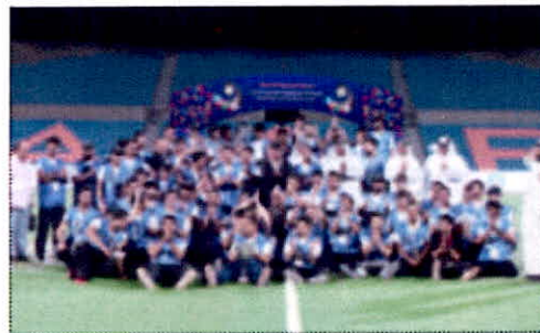
لاعبو فريق «التطبيقي» محتفلين بالتركة التالي

وتوجت الهيئة العامة للتعليم التطبيقي الكويتية مطلة للدورة لتحقيقها اكبر عدد من الميداليات في منافسات ألعاب القوى الثمانية في حين اسفرت منافسات مسابقة كرة القدم اخر مسابقات الدورة عن فوز فريق جامعة قابوس من عمان