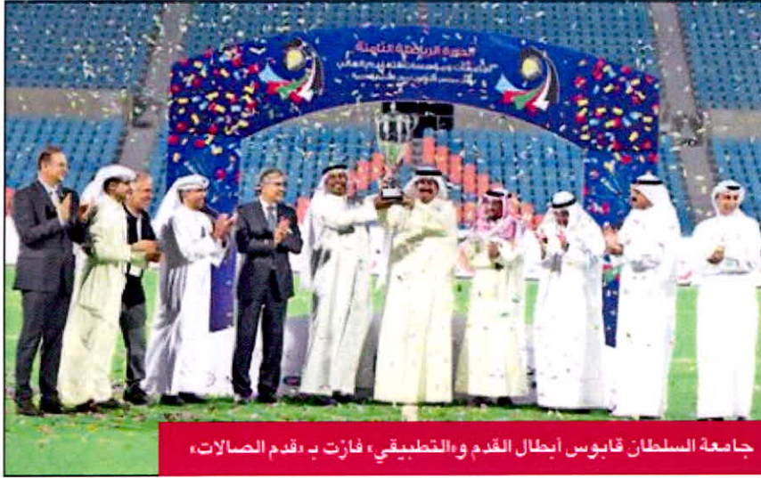
جامعة السلطان قابوس أبطال القدم والتطبيقي، فازت بـ «قدم الصالات»