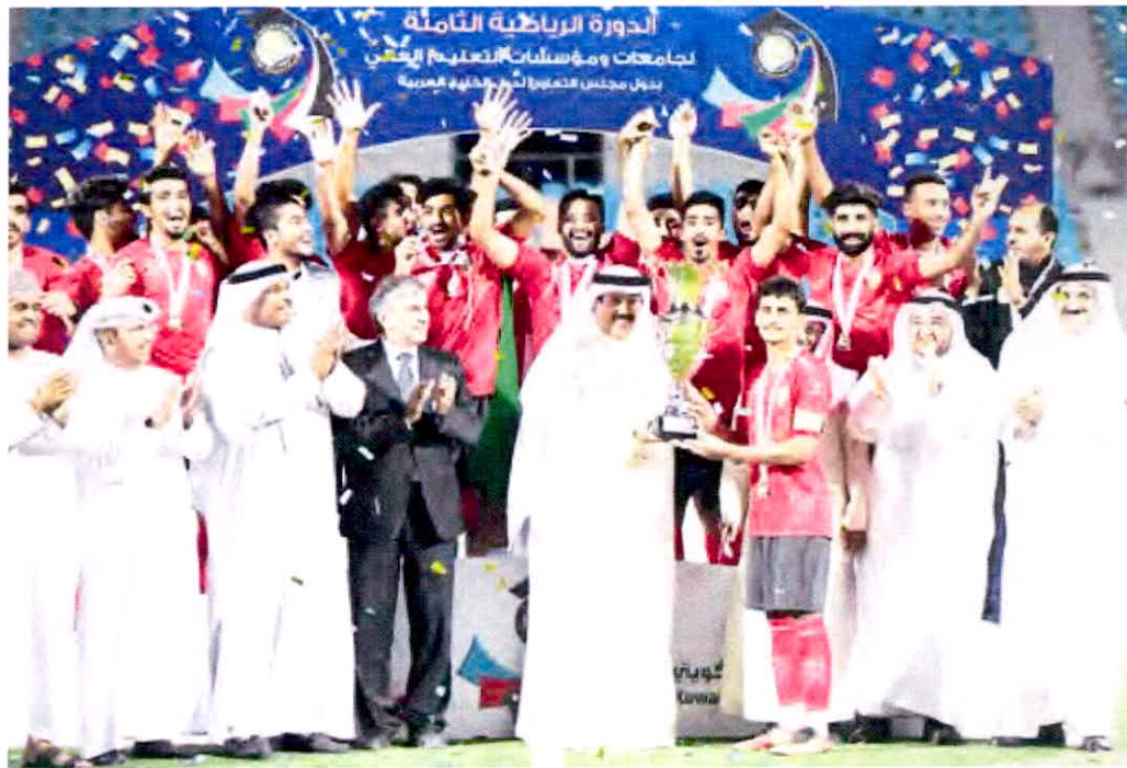
جانب من تتويج الفائزين

الهيئة في مختلف الألعاب والتي استضافت معظم منافسات الدورة.